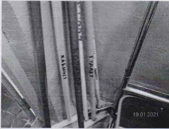
помещение хранения уборочного инвентаря